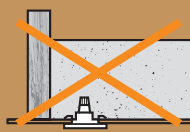
Pas de contact entre les points chauds et l'isolant.