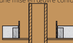
Réalisez un arrêtoir rigide en métal, bois, plâtre ou panneau rigide d'isolant classé au moins A2-s1, d0, à une distance de sécurité définie dans le NF DTU 24.1.