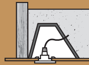
Posez un capot de spot conforme au DTU 45.11 sur les spots halogènes et à led(s).